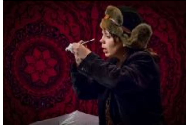
Adam en de Anderen (links), Lekker Belangrijk

Onder de noemer toneel-op-toneel speelde de voorstelling Bedrog een korte tour, in 2018 vervallen de rechten van dit stuk.