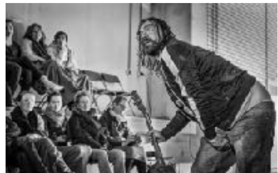
Oh Ja Joh Hoezo Dan (links) en KIWI

Ook introduceerde De Stokerij een nieuwe manier van touren: ze boden aan de theaters in Nederland een volledig festival aan: De Opstokereis . Dit festival stond één of voor meerdere dagen (waar behoefte aan was) in het theater en