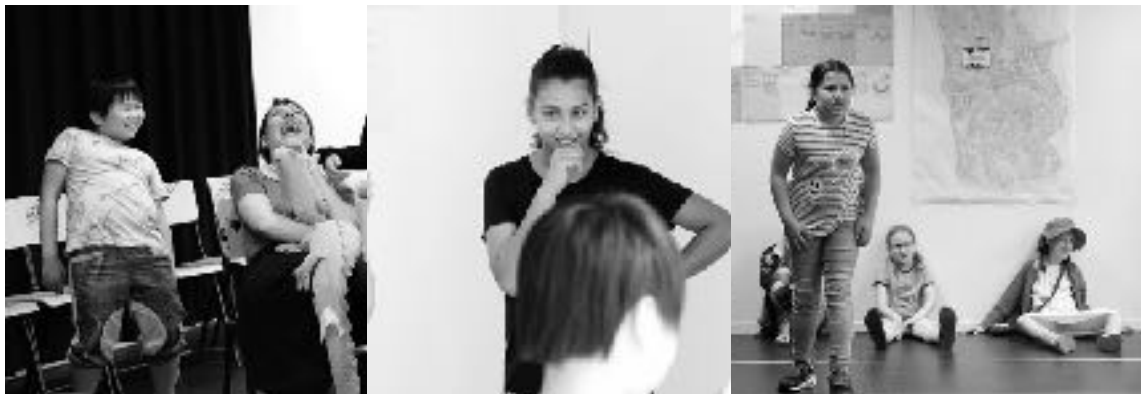
Repetitie Jonge Stokerij, fotografie Hans Anderson

voor workshops op school, waarna zij auditie mogen doen om lid te worden van De Jonge Stokerij (één keer per week les van profacteurs). De Stokerij is ervan overtuigd dat het meedoen aan podiumkunst de liefde ervoor aanwakkert en dat het naïef is om te denken dat publiek zichzelf opbouwt. Het werken met deze groep is wat De Stokerij betreft in alle opzichten een verrijking en het contrast tussen amateur en professional bleek bij Kleine Sofie met de juiste begeleiding en een uitgekiende regie geenszins storend. De Stokerij ziet het als haar taak om volwassenen met een passie voor toneel en kinderen die niet als vanzelfsprekend deelnemen in het jeugdtheateraanbod toch in aanraking te laten komen met toneel op hoog niveau. Door het omzeilen van instituten is diversiteit bovendien een gegeven.